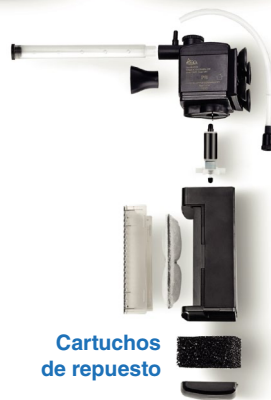
Cartuchos de repuesto